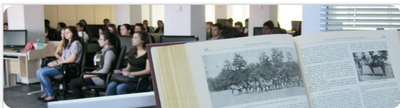
Biblioteca Universitară „Ioan Popișteanu”

Biblioteca Universitară „Ioan Popișteanu” este o bibliotecă de tip universitar, parte integrantă a sistemului național de învățământ care participă la procesul de instruire, formare și educare și la activități de cercetare, deservind prioritar studenții, cadrele didactice și cercetătorii din universitate.